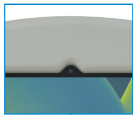
Kamera-Öffnung Vorder- und Rückseite