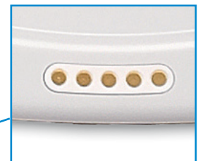
Simply-Dock® Laden ohne Kabel*