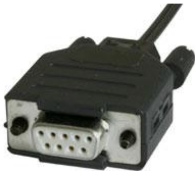
RS232 Isolator STD LWL 9Pin

Der RS232 Isolator STD LWL ist in 4 unterschiedlichen Kombinationen erhältlich, welche alle untereinander kombinierbar sind. Die Geräte sind mit einem patentierten Glasfaser Anschlussstecker ausgestattet, der es erlaubt, jede beliebige Kabellänge bis maximal 100 Meter herzustellen. Es werden keine Stecker, sondern lediglich ein scharfes Schnittwerkzeug zum Zuschneiden der LWL Kabel verwendet. Die konfektionierten Kabel werden einfach in die Umsetzer eingesteckt.