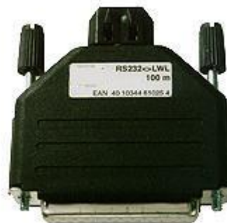
RS232 Isolator STD LWL 25Pin DCE